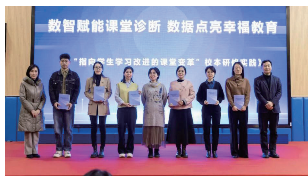
图2 专家、领导为学校教师赠送专著《指向学生学习改进的课堂变革》

自2019年启动幸福课堂建设至今,有效推动了学校课堂教学改革,实现了学生、教师、课程三个维度的同步提升。在学生层面,课堂参与度显著提高,从“被动接受”转变为“主动参与”;学业成绩稳中有升,养成了良好的习惯与能力;核心素养得到有效培育,学习获得感与幸福感受到提升。在教师层面,专业能力有所增强,教学设计、课堂驾驭、研究反思、教学研究等能力得到提升;教师队伍结构得以优化,专业梯队逐步形成;职业认同感与幸福感增强,教师对教育事业的热爱更加坚定。在课程层面,学校特色品牌与育人质量实现协同发展,构建起以教材为核心、以课标为依据的课程体系,提升了教学的规范性与有效性;打造出特色课程品牌,例如“地球科学”课程群荣获市级奖励。专著《指向学生学习改进的课堂变革》正式出版(如图2所示),是学校扎实推进“幸福课堂”实践落地取得丰硕成果的典型代表。