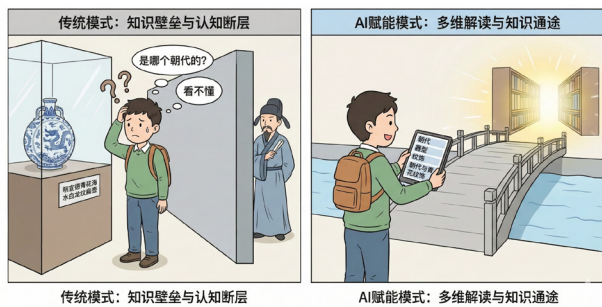
图1 传统参观模式与 AI 辅助模式下的公众认知路径对比

将人工智能技术引入文物鉴赏的最大意义，不在于用一个绝对标准的答案替代人类对文物的多元化解理解，而在于提供一种新的知识学习途径：它可以将文物专家鉴别经验中可复述的观察要点拆解出来，通过图像识别与可视化的提示词呈现给观众，并与专业知识进行对照校验，从而降低观者对于文物知识学习的门槛、易于进行知识图谱的构建。如图1所示，人工智能赋能模式可在观展者参观时辅助他们对展品进行多维解读。