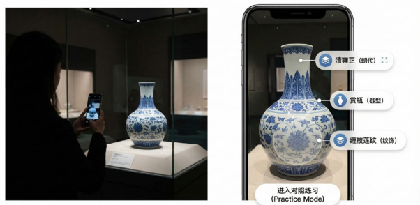
图4 AI赋能的数字导览与“识别—讲解—对照练习”闭环体验

在博物馆与学校的合作或课堂教学中，此系统可扩展为“学习—练习—复盘”的任务链形式：首先，围绕经典器型与纹饰母题提供示例与对比图；随后，在练习阶段引导学生先独立判断，再查看系统提示与专业解读；最后的复盘阶段引导学生记录误判的原因、总结可迁移的观察策略。通过此类反复对照练习，系统承担的不再仅仅是给出答案的角色，而是成为一个引导者，促进学生的学习、交流、反馈。图3展示了导览与练习闭环的体验场景。