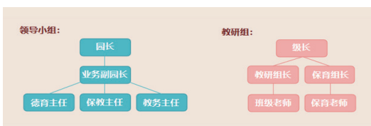
“莞美”园本课程管理运行架构图

2. 课程实施路径：幼儿园依托五大课程活动内容，以“莞”“馆”“管”相融，将主题、区域、游戏、家园社区、节庆日及社会实践活动与环境创设相融，依托家园共育为纽带，打造