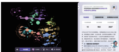
图1 木材科学与工程专业核心课知识图谱构建

基于知识清单与本体框架，实现知识节点与关系的可视化呈现。绘制过程中，按照知识层级（专业核心知识-课程核心知识-章节知识点-具体概念/原理）对知识节点进行分层展示，确保知识图谱的清晰性与逻辑性 [9]。完成初步绘制后，组织研发团队与学生代表对知识图谱进行审核，结合教学实践需求优化知识节点的划分、关系的定义与图谱的呈现形式，提升知识图谱的适用性。