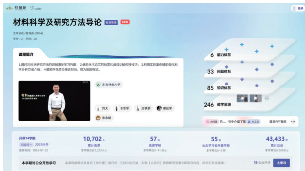
图2 《材料科学及研究方法导论》知识图谱智慧课程主页

以东北林业大学木材科学与工程专业2023级两个平行班作为教学实践对象, 选取专业核心课程《材料科学及研究方法导论》进行教学实践, 其中图谱班(29人)采用核心课程知识图谱赋能的教学模式, 混合班(30人)采用基于慕课的线上线下混合式教学模式, 教学实践周期为一学期。在课程开展之前, 通过问卷调查与知识测试, 确保两个班级学生的专业基础、学习能力无显著差异;教学过程中, 图谱班采用知识图谱融入课堂教学、线上自主学习与个性化教学的模式, 混合班采用线上慕课视频学习集合线下课堂PPT讲解与板书教学模式。教学实践结束后, 通过期末考试、问卷调查与访谈, 对比分析两个班级的教学效果。