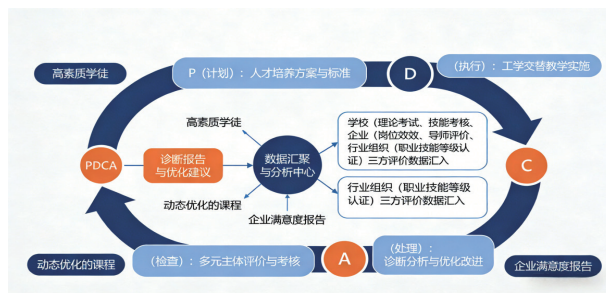
图2 基于多元评价的现代学徒制质量持续改进闭环

推进行业主导的“多元参与”质量评价与反馈机制： 建立由学校、企业、行业组织、甚至学徒本人共同参与的多元评价体系。核心是引入行业组织或第三方评价机构，开发基于国家标准、融入企业典型工作任务的能力认证标准，对学徒进行职业技能等级认定 [9] 。将企业导师对学徒的岗位绩效评价、学徒满意度调查等作为重要指标。所有评价数据应汇聚分析，形成诊断报告，定期反馈至管理委员会，用于持续优化培养方案、课程内容和教学方式，形成“评价—反馈—改进”的质量闭环 [10] 。