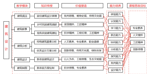
图1 “知识+能力+价值+课程思政”四维一体的课程体系

通过上述融合, 专业知识成为承载价值观的天然容器, 形成“思政引领、知识获取、能力提升、价值塑造”四维螺旋上升的一体化课程体系。