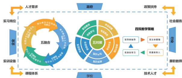
图1 “四协同·五融合·五对接·四双制”育人模式