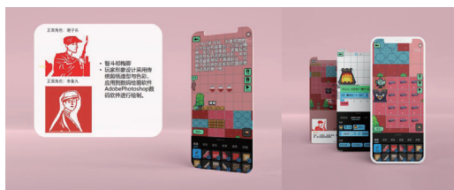
图4 以清涧起义片段为主题。

案例以谢子长革命事迹为主题，要求学生团队以谢子长英雄事迹为线索，构建“出生成长—革命斗争—壮烈牺牲—精神传承”四个篇章，运用动态插画、音频解说、互动问答等形式，打造沉浸式红色文化传播 H5，通过视觉叙事手法展现英雄的革命生涯和精神品质 [11] 。项目实施过程中，学生首先需要深入研究谢子长的革命事迹，包括其早期革命活动、清涧起义、渭华起义、西北革命根据地的创建等关键事件，提炼故事主线和高光时刻；然后进行剧本创作，将英雄事迹转化为分镜头脚本，确定叙事节奏和情感高潮；最后进行绘制和排版，完成连环画创作。在这一项目中，学生需要综合运用角色造型、场景设计、构图叙事等设计表现方法，塑造英雄形象，讲述革命故事 [12] 。例如，在表现谢子长在河口战斗中负伤仍坚持指挥的场景时，需要通过表情、动作、场景等视觉元素，传达英雄的坚毅和勇敢。通过这种深入的角色塑造和情感表达，学生不仅提升了设计表现能力，也在创作过程中受到了英雄精神的熏陶和感染。