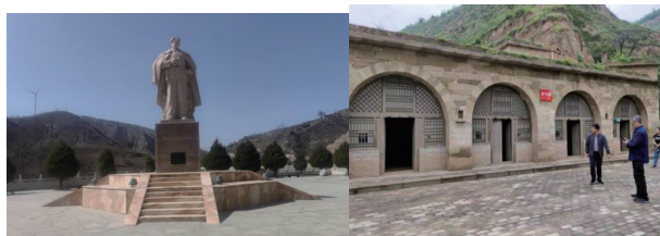
图1 谢子长雕像(作者自摄) 图2 谢子长故居(作者自摄)

子长市作为中国革命的“红都”之一,拥有丰富而独特的红色文化资源。这些资源不仅是历史的见证,更是思政教育的宝贵财富。1935年,中共中央率领中央红军到达陕北,在瓦窑堡召开了具有里程碑意义的政治局会议,确立了抗日民族统一战线的策略,子长红色文化蕴含着丰富的革命精神和厚重的历史底蕴,为思政教育提供了鲜活的地方素材。