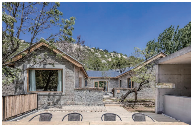
> 图1 沂蒙山舍

宿+文化”特色品牌。例如，蒙阴县金水前城民宿集群内设非遗文化馆，展示沂蒙当地文化作品，平邑县“沂蒙山舍”以石头建筑和生态木屋为特色吸引游客等等，通过设计加强了民宿与当地文化的交融，让游客更加沉浸式的体验当地文化。同时临沂文旅集团提出“民宿+”模式，延伸产业链条，此模式可打造“民宿+非遗”“民宿+康养”“民宿+研学”等融合模式以带动相关产业融合发展。例如平邑县通过民宿带动周边村民就业，发展特色餐饮和手工艺店铺，形成“吃住行游购娱”一站式服务。蒙阴县还引入“民宿+剧本杀”“民宿+旅拍”等新业态，提升消费吸引力。 [6] 并积极用新媒体，新技术等方法加大宣传力度，形成了一定的民宿规模格局，也得到了游客们非常积极的评价。