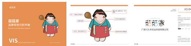
>图二:“菇菇家”赤西村食用菌产业示范基地品牌设计 作者:于爽等

服务好旅游消费者,为游客提供良好的情绪价值,满足消费者多样化伴手礼的需求,才能最终实现城乡协调共同发展。