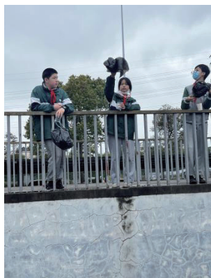
图3：学生测试降落伞性能

组织各小组对同伴表现、自我认同和降落伞制作质量展开过程评价，以下是学生在探究中使用的过程评价量表。