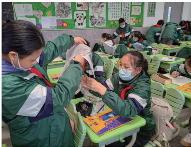
> 图2：学生制作降落伞

意图：工程项目强调以小组合作、自主探究的方式展开学习，充分发挥学生的学习积极性和主观能动性，留给學生充足时间思考、交流和实践。教师关注学生学习表现，鼓励学生相互帮助，发挥团队合作精神。