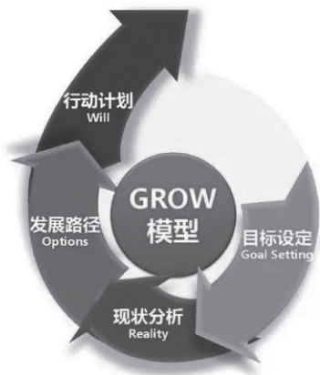
> 图1: GROW思维模型图

人就像一块未经雕琢的玉石，每一块都蕴含着成为璀璨宝石的潜能。约翰·惠特默在1992年提出了GROW思维模型（见图1），这一模型在生涯规划的领域中备受瞩目。 [3] 它的核心理念在于通过引导式的教练方式，让咨询者能够自主探寻答案，并制定出切实可行的行动方案。针对小李在就业过程中出现的问题，我们可以运用该模型提出以下解决思路：