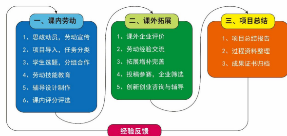
> 图1 劳动教育实践形式具体流程与操作步骤示意图

课内评分评选。教师参考专业劳动课程教学大纲考核要求,对于完成劳动任务的小组作品评分,并加以点评。