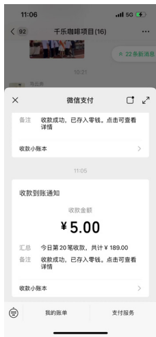
> 图5 咖啡销售金额截图