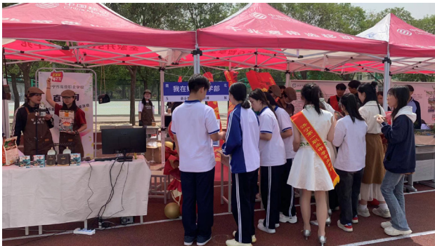
> 图6 推演现场

推演结束后，指导老师根据教学内容，自制学生学习能力评估表（Cronbach’s 阿尔法系数为0.946，重测信度为0.866），涵盖技能、商务礼仪、沟通交流3个部分，每个部分满分100分，得分越高表示技能掌握水平越好。