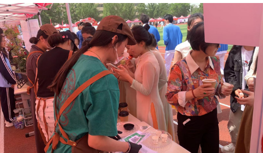
> 图3 零售组现场