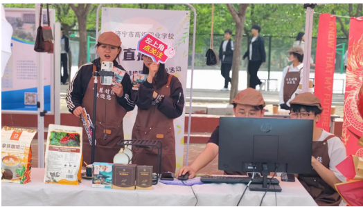
> 图2 直播销售组设备

直播样品咖啡由北京博导前程信息技术股份有限公司提供，直播产品的返利也通过该公司进行核算，其余设备由学校提供。