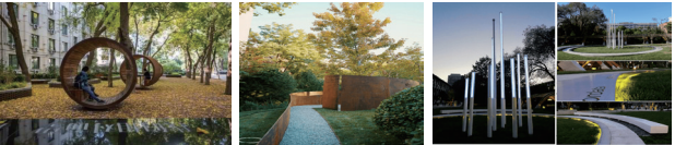
> “树洞花园”空间 “林之心”空间 “林中密语”空间 “生物圈环”空间

创建一个舒适、自然、安全的校园环境是提升校园质量的关键。在设计中，应合理将空间划分为开敞、半开敞及私密空间。以北京林业大学的“林之心”项目为例，将设计区域分为四个独特类型的空间，满足不同人群需求，创造独特场所记忆。（如图2）。半开放空间包括“树洞花园”和“折纸”，解决了空间多功能与陌生人对视问题。而“林中密语”作为隐私空间，通过互动感应装置增加了互动性和趣味性。最后，“生物圈环”作为开放空间，实现校园景观与人自然互动。