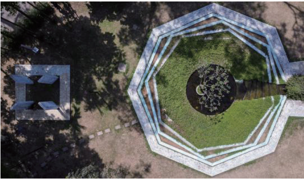
> 图1 达卡大学文学院校园景观局部图

在景观设计中，应根据学校所在地的文化特色进行设计，选择适应该地气候的植物并科学搭配，以提升绿化水平和美化校园景观。同时，利用校园的历史建筑、百年树木、人文雕塑等元素，传承历史文化，突显学校独特特色 [3] 。例如孟加拉国达卡大学文学院的景观设计（如图1）。中心区的八边形图案、水面和庙树与纪念碑的组合创造了宁静的氛围。各个区域通过特色元素表达独立、自由等追求，采用当地材料和创新处理，以色彩丰富的水泥覆盖砖块、金属元素等，融合了当地工艺和机械制造的美感，体现了城市与校园的文脉共融。